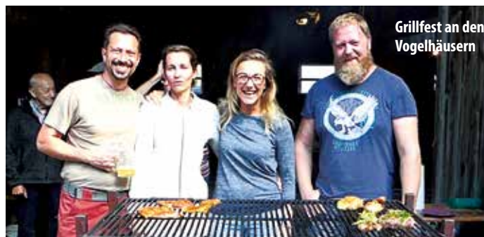
Grillfest an den Vogelhäusern