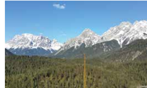
Blick auf die Zugspitze und Sonnenspitze