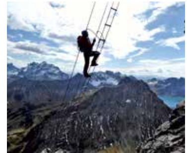
Himmelsleiter am Klettersteig Saulakopf