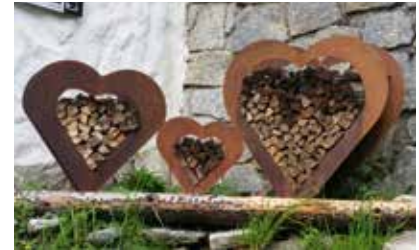
Herzliche Grüße vom Berliner Höhenweg