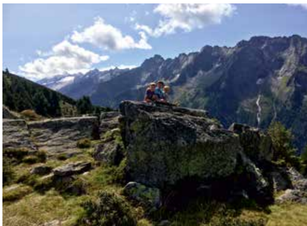
Fotowettbewerb 2017 Zillertaler Hochalpen