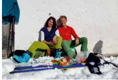
Gedeckter Frühstückstisch... Pistenskitour auf der Neunerköpfl