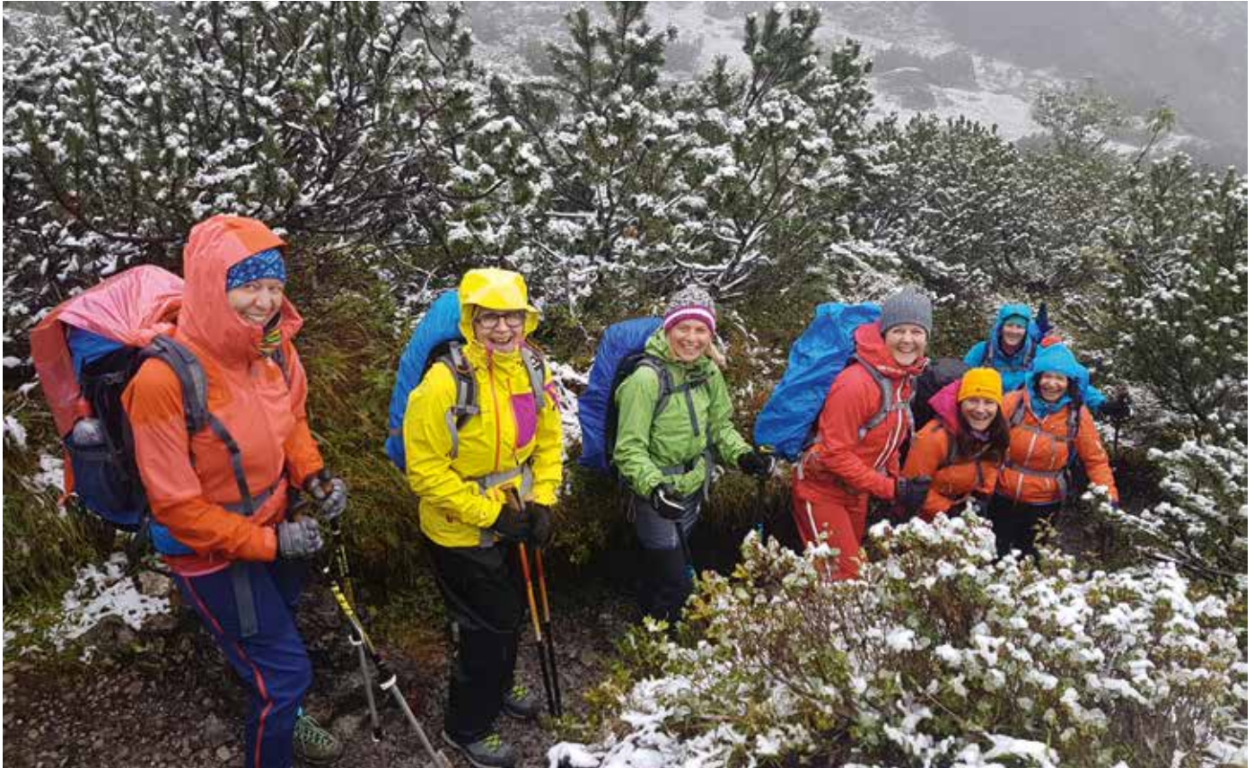
Fotowettbewerb 2017 - Auf dem Berg die Freude - Foto: Elisabeth Walch