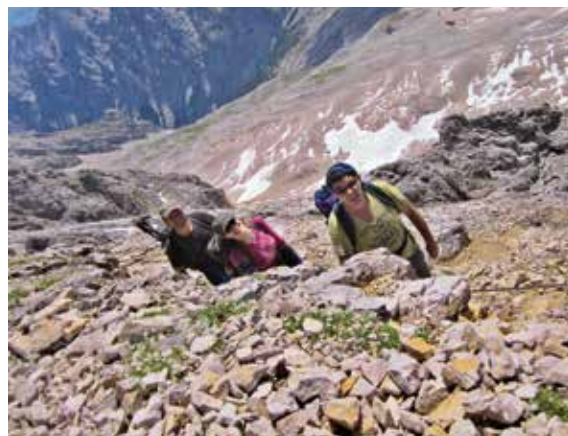
Fotowettbewerb 2017 - Zugspitzgrat