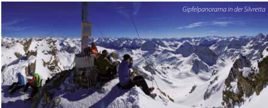
Gipfelpanorama in der Silvretta