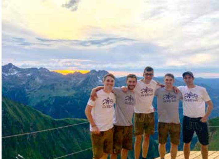
Fotowettbewerb 2017 Waltenberger Haus