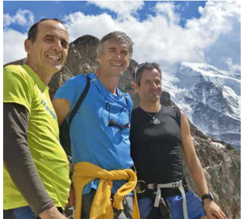
Fotowettbewerb 2017 - vor dem Piz Palü - Foto: Peter Wiedemann