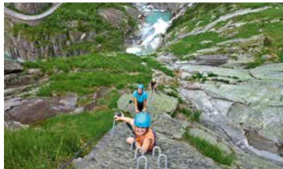
Fotowettbewerb 2017 - Teufelsschlucht bei Andermatt