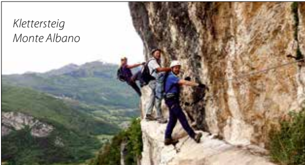
Klettersteig Monte Albano