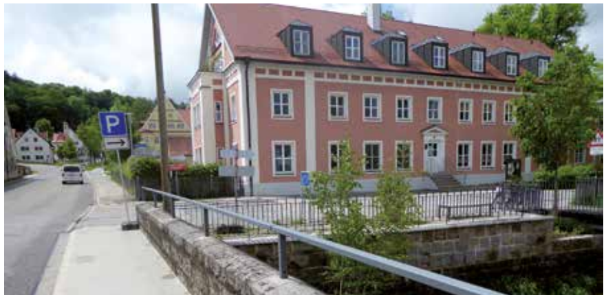
Geschäftsstelle Sektion Mindelheim