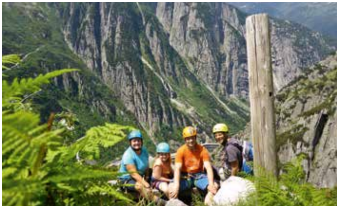
Fotowettbewerb 2017 - Klettersteig in der Teufelsschlucht bei Andermatt