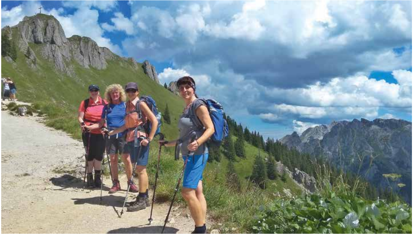
Fotowettbewerb 2017 - Über die Marienbrücke zum Tegelberg