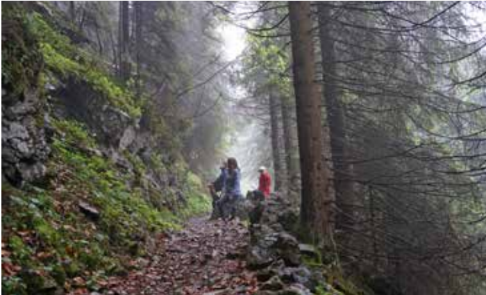
Fotowettbewerb 2017 - Bolsterlang