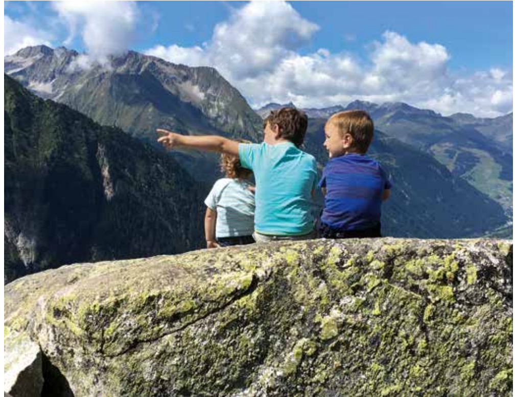
Fotowettbewerb 2017: 2. Platz: Zillertaler Hochalpen

Anmeldungen zum Tourenprogramm sind ab dem 01. 12. 2017 möglich