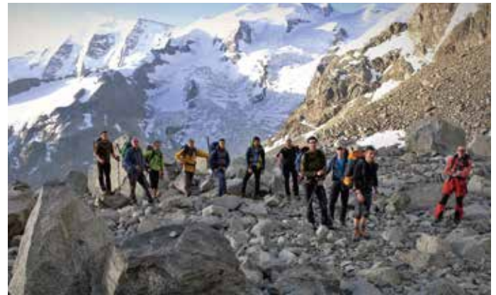
Fotowettbewerb 2017 - Rast beim Zustieg zum Piz Morteratsch