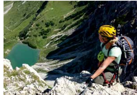
Aussicht vom Nordwand-klettersteig