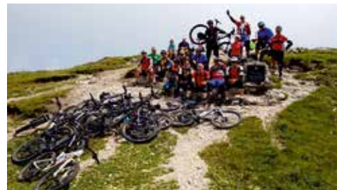
MTB-Tour auf den Roen