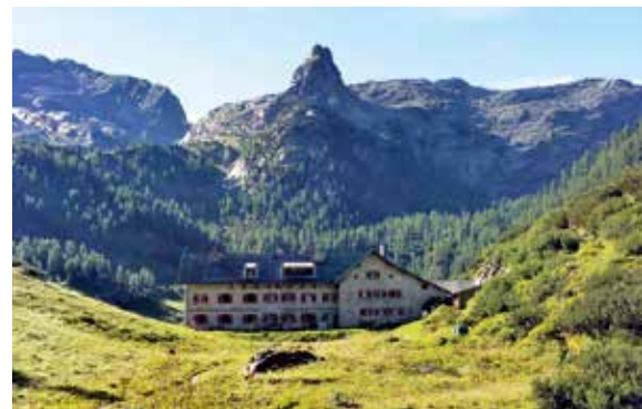
Wohlfühl-Hütte - Kärlinger Haus, Berchtesgaden