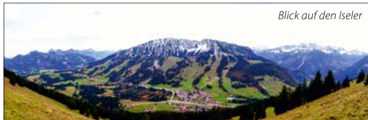
Blick auf den Iseler