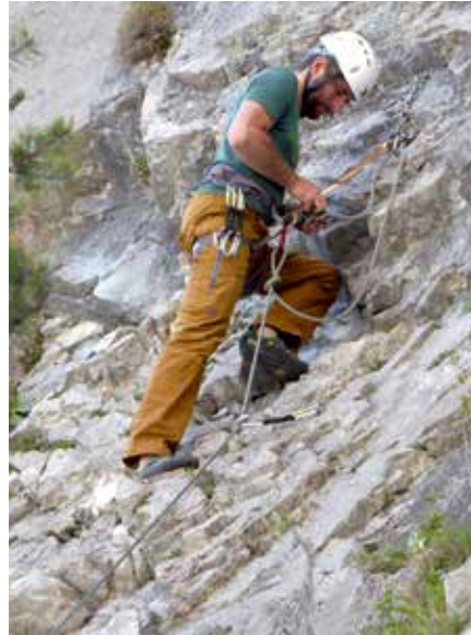
Felskletterkurs - Übung zum Umbinden