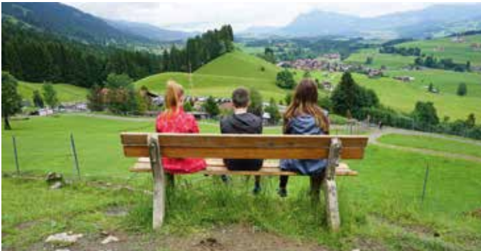
Fotowettbewerb 2017 - Obermaiselstein - Foto: Sophie Müller