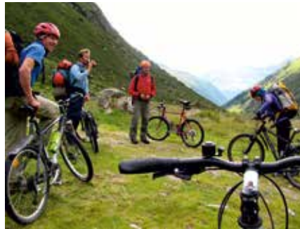
Pause vor der Abfahrt