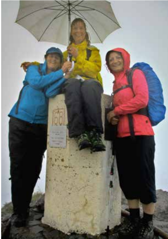
Fotowettbewerb 2017 - Drei Mädels besuchen die Drei Schwestern - Foto: Günther Maute