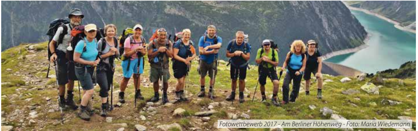
Fotowettbewerb 2017 - Am Berliner Höhenweg - Foto: Maria Wiedemann