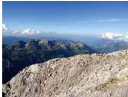
Gipelfernsicht übers Lechtal