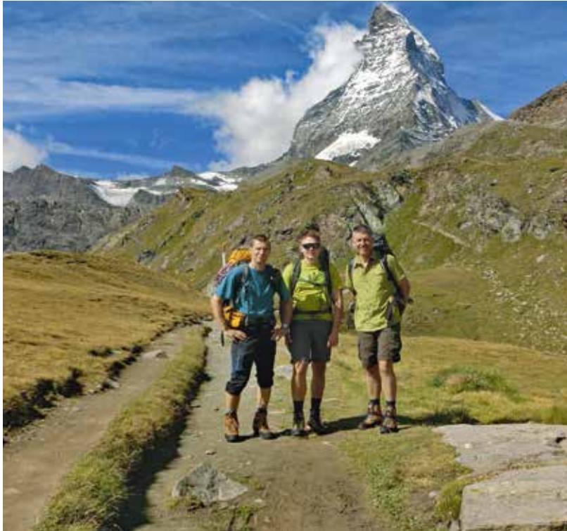
Fotowettbewerb 2017 - Matterhorn