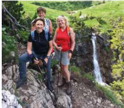
Fotowettbewerb 2017 - Vor dem Gaisalpsee - unterhalb des Rubihorns

Trainingsabend für geübte Mountainbiker in der Umgebung von Unterrieden. Wir fahren eine Strecke von ca. 30 km mit etwa 500 Hm. Ausgangsort: Sportplatz in Unterrieden, Fahrzeit: 2 Std., Abfahrtszeit: 18.00 Uhr, Treffpunkt: Sportplatz Unterrieden, max. Teilnehmeranzahl: unbegrenzt, Ausrüstung: Beleuchtung, Leitung: Sabine Müller