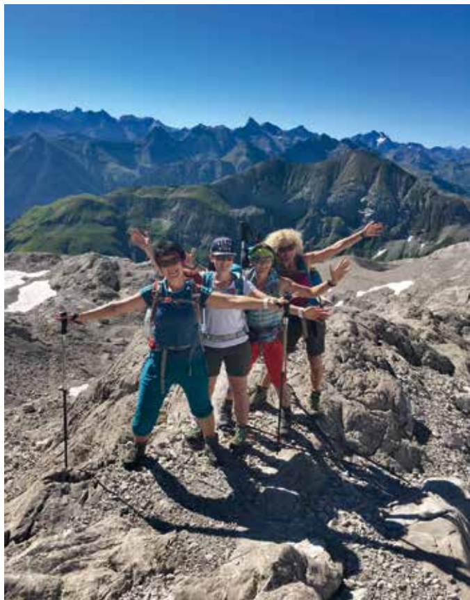
Fotowettbewerb 2017 - Heilbronner Weg - Foto: Christine Heim