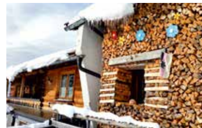
Blumengrüsse von der Gaisalpe