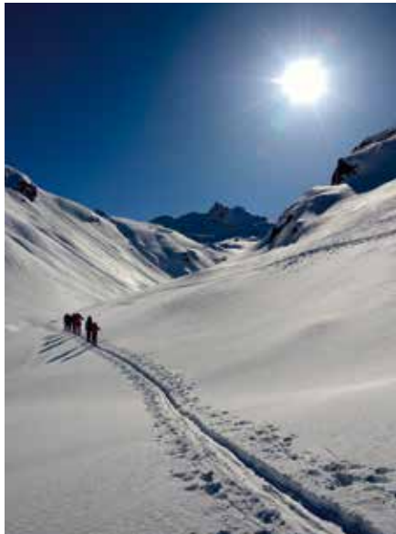
In der Silvretta