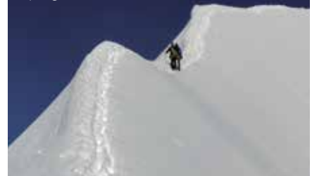
Gipfelgrat vom Piz Palü