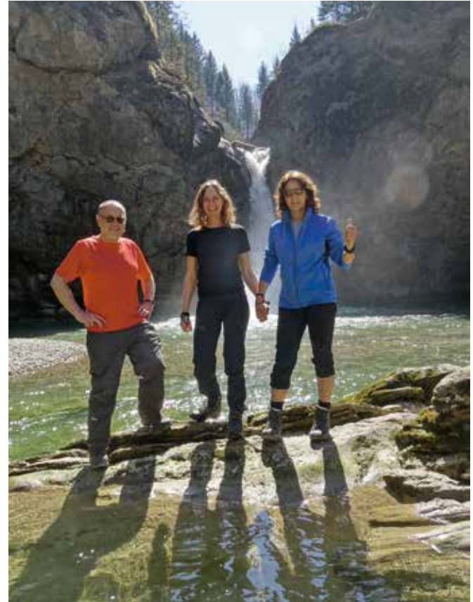
Fotowettbewerb 2017 - Buchenegger Wasserfälle - Foto: Erwin Marschall