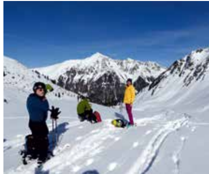
Im Sellrain unterwegs