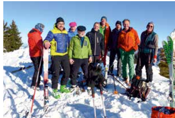
Auf dem Sonnenkopf bei Sonthofen