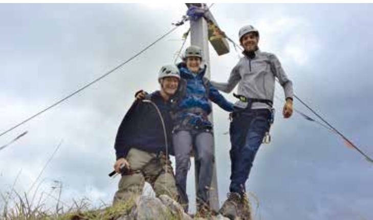
Fotowettbewerb 2017 Auf dem Gipfel des Geiselsteins