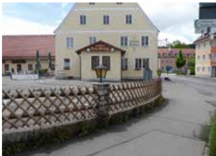
Gasthof »Drei König«

Soweit nichts anderes erwähnt ist, finden die Versammlungen/Sektionsabende in Mindelheim im Gasthaus „Drei König“, Memminger Str. 1, statt. Beginn ist jeweils um 19.30 Uhr. Es werden auch die Touren der kommenden Wochen vorgestellt. Es besteht die Möglichkeit sich individuell und persönlich zu informieren. An diesen Abenden können sich die Mitglieder näher kennen lernen und die Kameradschaft pflegen.