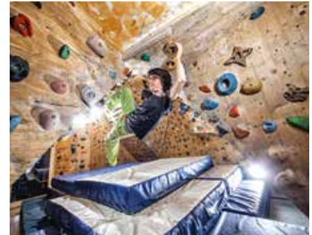
Boulderraum in der Geschäftsstelle